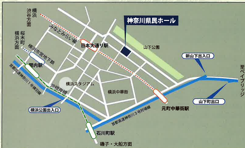
神奈川県民ホールアクセスマップ 所在地：横浜市中区山下町3-1

みなとみらい線日本大通り駅より徒歩約6分 JR根岸線・市営地下鉄関内駅より徒歩約15分