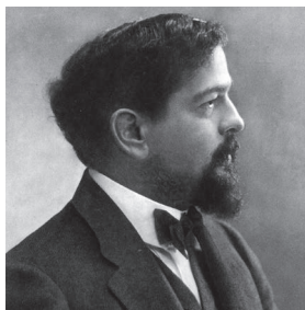
クロード・ドビュッシー Claude Debussy