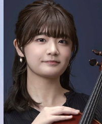
三国レイチェル由依 ヴィオラ