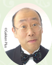
【お話し・ピアノ】 青島 広志

テレビやコンサートで おなじみの青島広志による 人気のレクチャーコンサート。 今回は「ポーの一族」などの 名作を生み出し続けている、 少女漫画のパイオニア・萩尾望都さんを ゲストに迎え、演奏をまじえながら 少女漫画の魅力を とことんご紹介します!