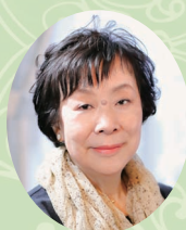
【ゲスト】 萩尾 望都