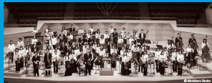
管弦楽 小澤征爾音楽塾オーケストラ Orchestra: Seiji Ozawa Music Academy Orchestra

小澤征爾音楽塾は、ローム株式会社の佐藤研一郎社長(当時)と小澤征爾が、オペラの実践による若い音楽家の育成を目的に2000年に立ち上げた、世界でも稀な教育プロジェクト。毎年、国内外でのオーディションにより選ばれた優秀な若い音楽家達によるオーケストラを結成。世界の歌劇場で活躍する歌手や演出家と共に高水準のオペラ公演を創り上げている。塾生の中からは、ソリスト、オーケストラのコンサートマスターや首席奏者として活躍する者も多く、着実に成果をあげている。