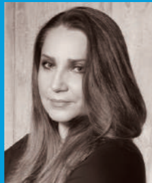
デスピーナ バルバラ・フリットリ Despina: Barbara Frittoli