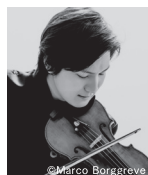
成田達輝 ヴァイオリン NARITA Tatsuki, Violin