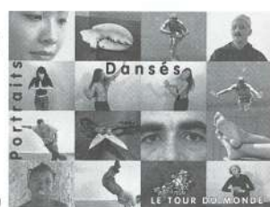
frisesques: Philippe Demard