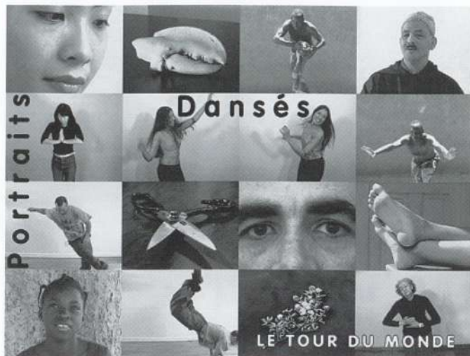
fresques: Philippe Demard

さまざまな土地に生きる人々の感情や身体表現を通し、世界を感じる。 ビデオ、写真、ダンスによる異色の展覧会+パフォーマンス。