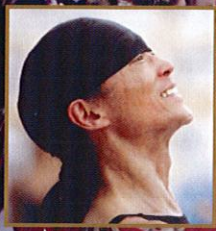
【台本・構成・演出・振付】 清水哲太郎

ペスト禍の絶望の中世から希望のルネサンスにおどり出て来た人類は どんなことに襲われようとも動かしがたい人間性の気品をばねとして 当然のように人々の幸福のため“どん底”を“希望”に変える。